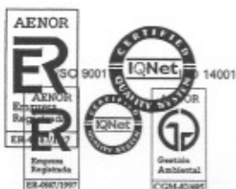
Antoni Tachó i Figuerola